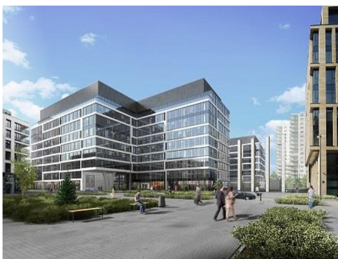
Grupa Aviva przeniesie się do GBC II w 2016 r.

Aviva wynajęła 12 500 m kw. w budowanym obecnie budynku C. Przeniesiona zostanie tam centrala grupy, która w tej chwili zajmuje podobną powierzchnię w kompleksie Platinum Business Park IV na Służewcu. Oprócz przestrzeni biurowej w GBC II Aviva wynajęła również 400 m kw. na parterze biurowca A, zrealizowanego w ramach GBC I i oddanego do użytku w czerwcu 2014 r. Spółka otworzy tam Biuro Obsługi Klienta oraz Oddział. HB Reavis w procesie negocjacji wspierała warszawska kancelaria Galt.