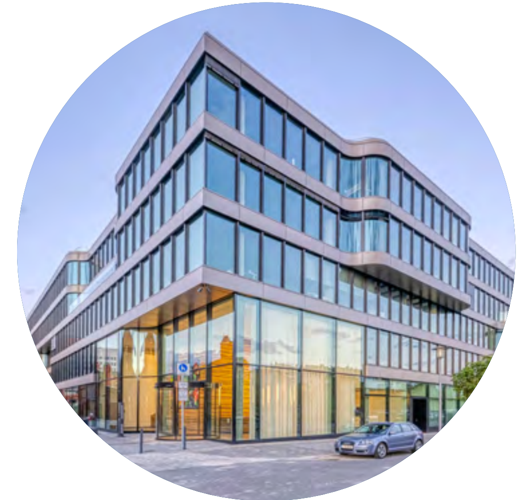
Berlin, DSTRCT.Berlin, 46 000 mkw., 2022