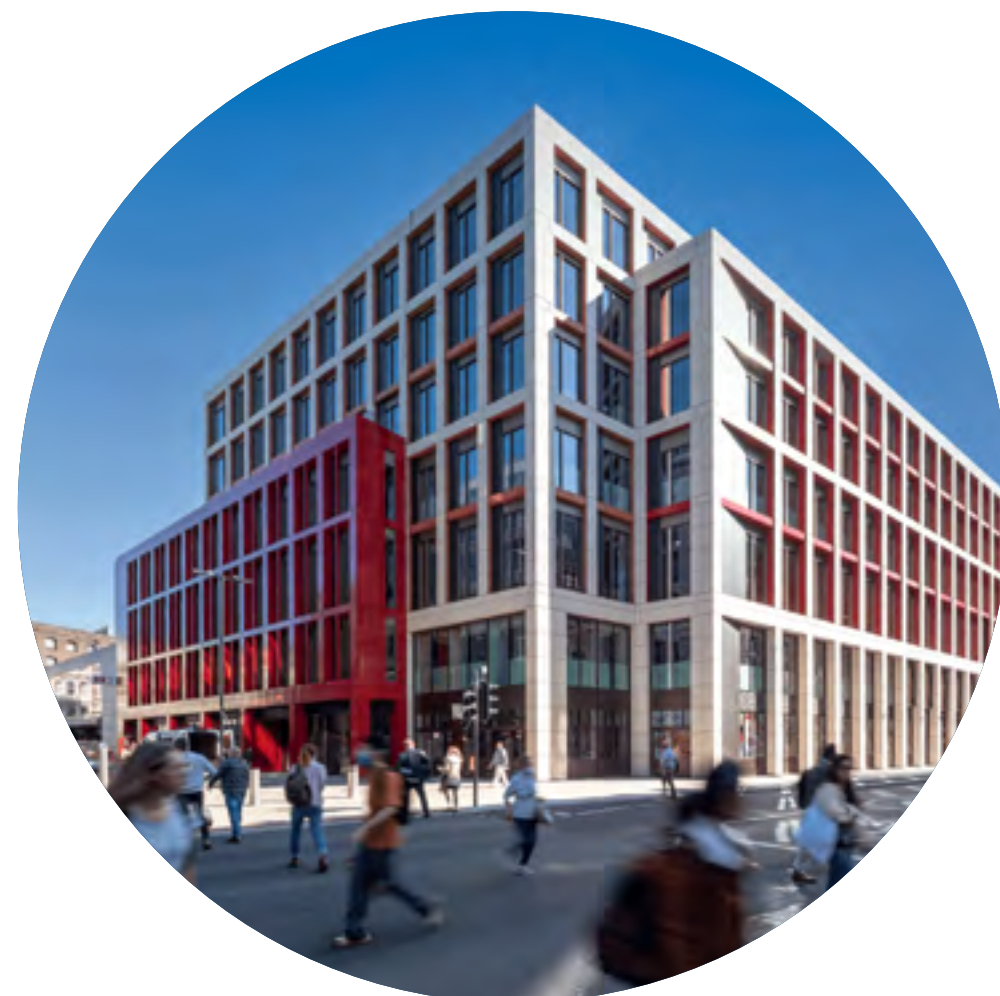
Londyn, Bloom Clerkenwell, 13 000 mkw., 2021