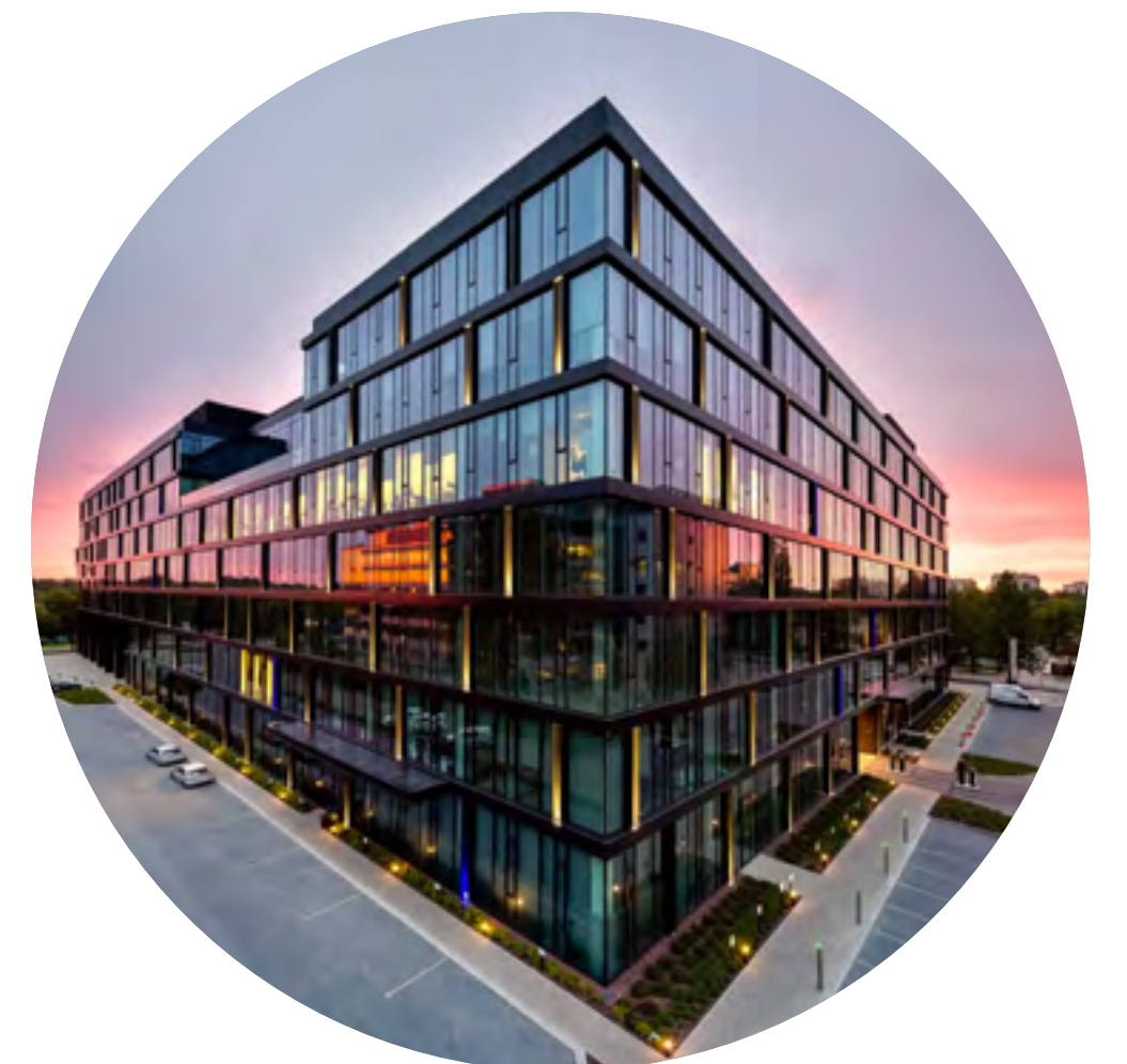
Warszawa, Konstruktorska Business Centre, 49 000 mkw., 2013