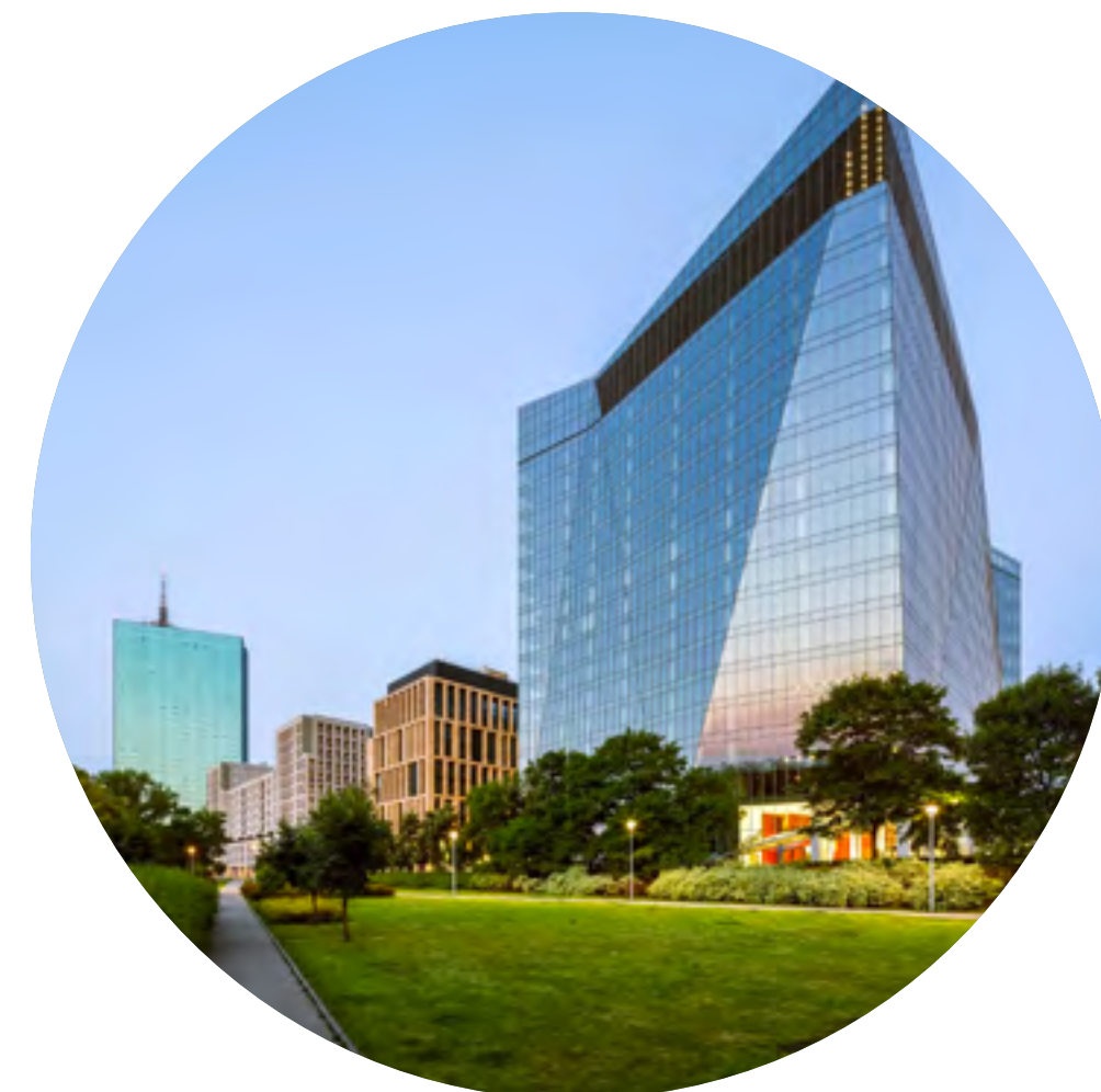
Warszawa, Gdański Business Centre I, 48 000 mkw., 2014