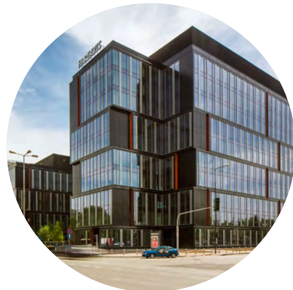
Warszawa, Postępu 14, 34 000 mkw., 2015