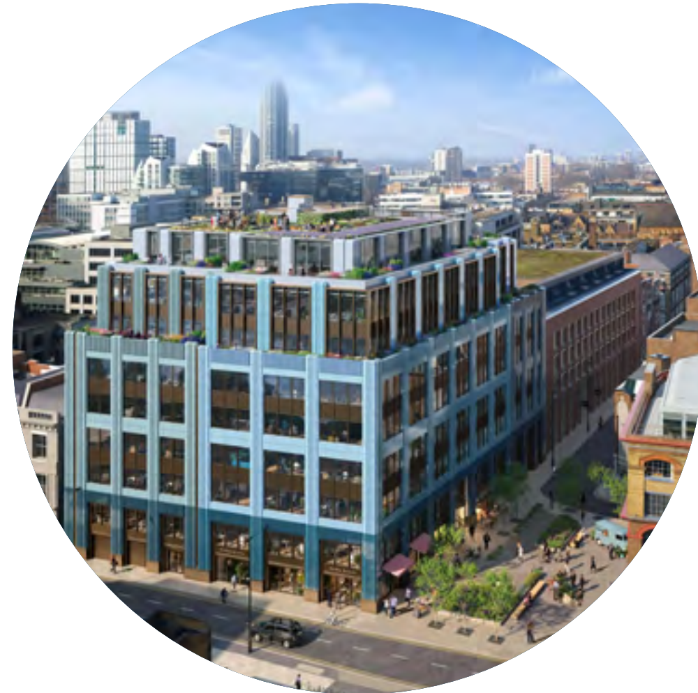
Londyn, Worship Square, 13 000 mkw., 2023