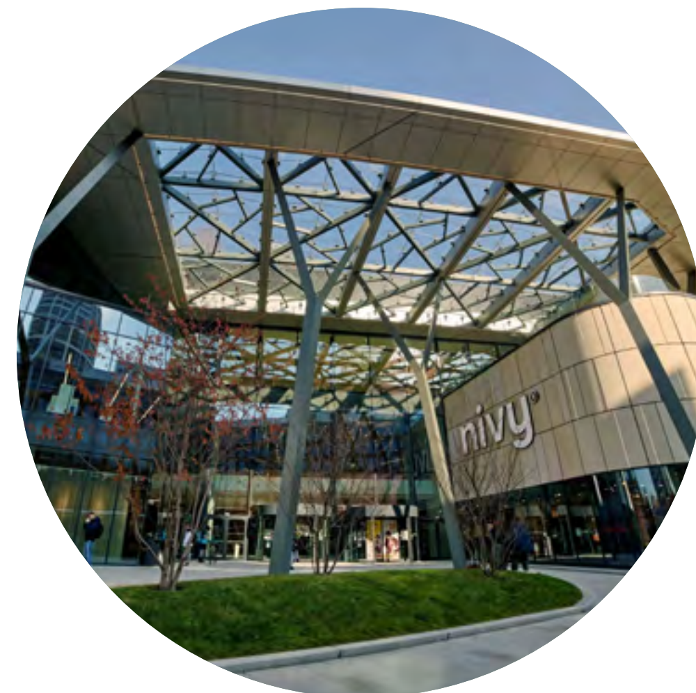
Bratysława, Nivy, 102 000 mkw., 2021